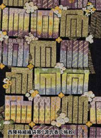
西陣極細織袋帯「源氏香几帳紋」