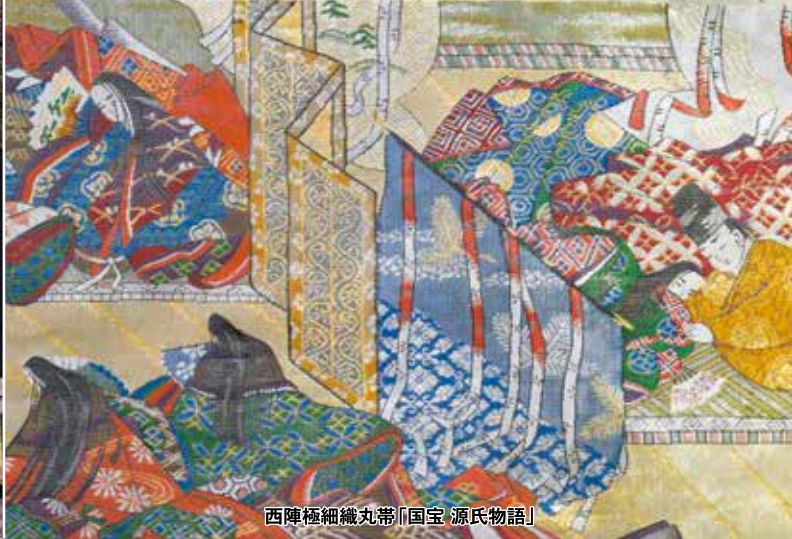
西陣極細織丸帯「国宝 源氏物語」