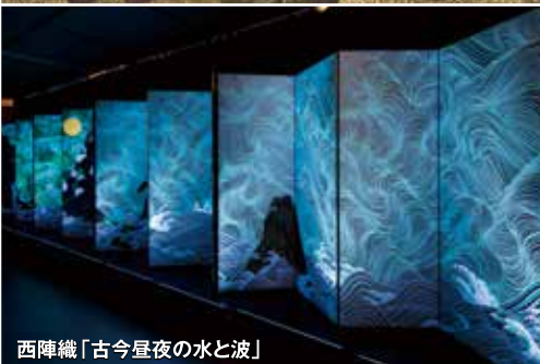
西陣織「古今昼夜の水と波」

国宝「日月山水図」と、俵屋宗達の「松島図」をベースに、暗闇で輝く著光糸を使い、幻想的な風景を織り上げました。