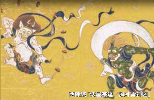
西陣織「俵屋宗達／風神雷神図」