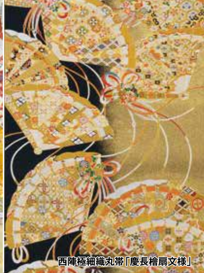
西陣極細織丸帯「慶長檜扇文様」