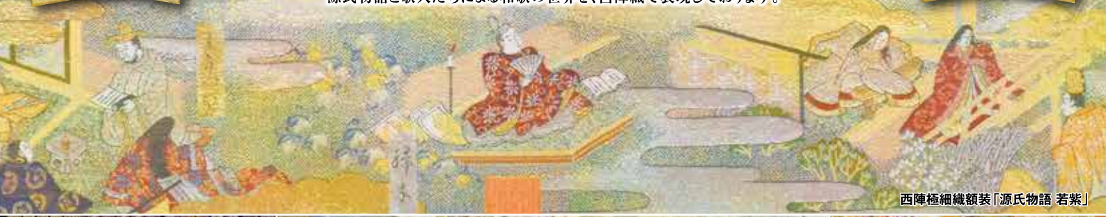
西陣極細織額装「源氏物語 若紫」

源氏物語が成立した1000年ごろは、藤原氏を中心とした貴族文化が花開いた時代です。 華やかな装束に身を包み、和歌や管弦に興じる平安貴族たちの雅な生活は、現代に生きる私たちにも憧れます。 源氏物語と歌人たちによる和歌の世界を、西陣織で表現しております。