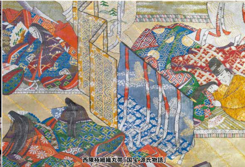
西陣極細織丸帯「国宝 源氏物語」