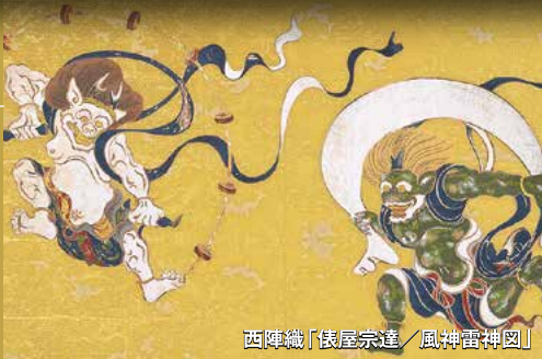
西陣織「俵屋宗達 / 風神雷神図」