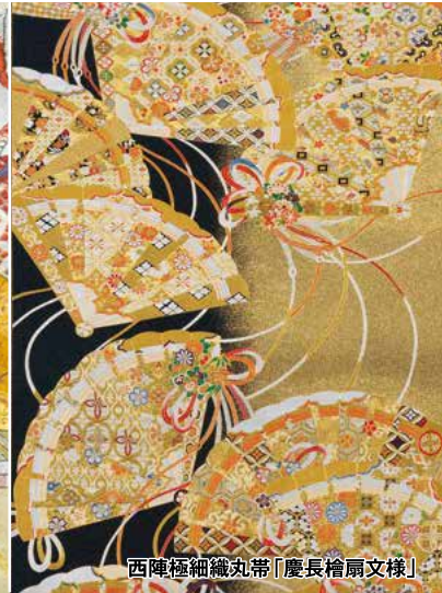
西陣極細織丸帯「慶長槍扇文様」