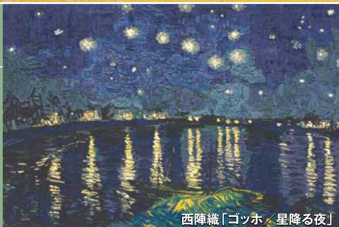
西陣織「ゴッホ / 星降る夜」

印象派の特色である光…様々な織技法でペイントタッチを表現し優美に織り上げました。