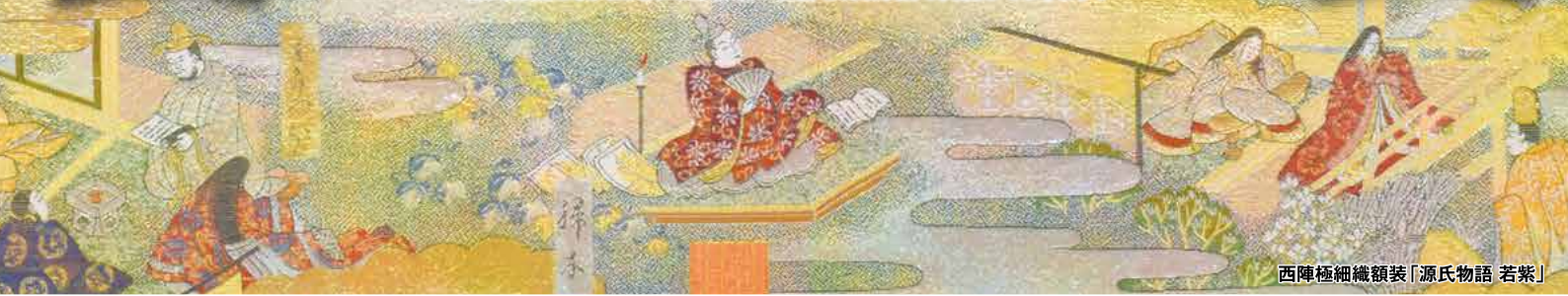
西陣極細織額装「源氏物語 若紫」

源氏物語が成立した1000年ごろは、藤原氏を中心とした貴族文化が花開いた時代です。 華やかな装束に身を包み、和歌や管弦に興じる平安貴族たちの雅な生活は、現代に生きる私たちにも憧れます。 源氏物語と歌人たちによる和歌の世界を、西陣織で表現しております。