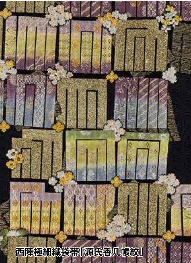
西陣極細織袋帯「源氏香几帳紋」