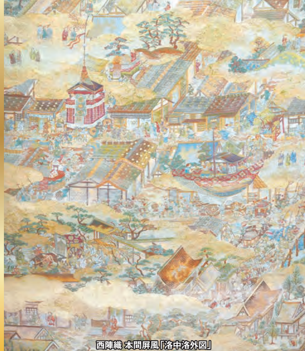
西陣織 本間屏風「洛中洛外図」

金銀を用いた華やかな表現、大胆な構図、余白を活かしたデザインを特徴とする、江戸時代に成立した芸術の流派、琳派。時を経て、日本の工芸品はヨーロッパへと渡り、ジャポニズムとして印象派の芸術家に影響を与えました。それらの美意識に着想を得た西陣織の作品は、金糸や多彩な色糸を用い、絵画や光の表現を織で再現し、繊細さと華やかさをあわせ持ちます。伝統の技と新たな感性が融合した西陣織の世界をぜひご覧ください。日本と西洋の美が響きあう奥深い魅力をご体感いただけます。