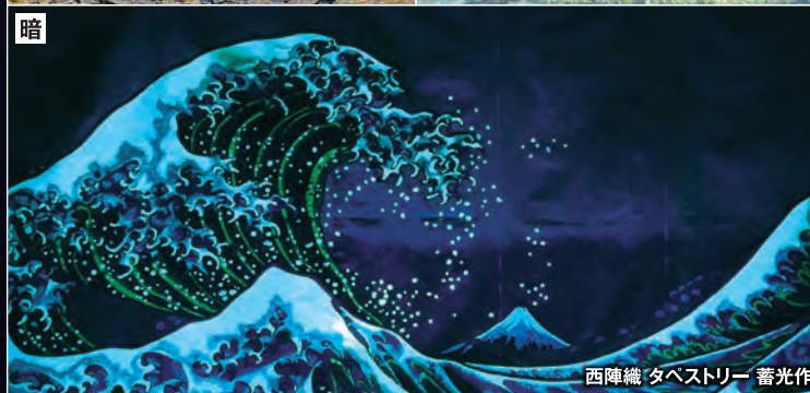
西陣織 タベストーリー 蓄光作品「葛飾北斎/神奈川沖浪裏」