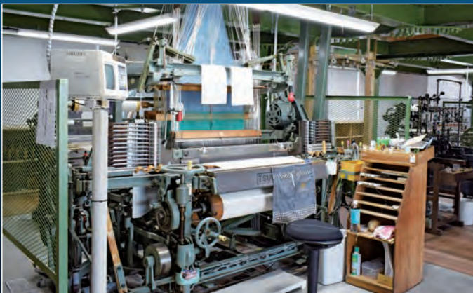
1F オープンファクトリー | 高度な織技術の伝承と若手育成の生産基地として、職人による製織工程を間近でご覧いただけます。