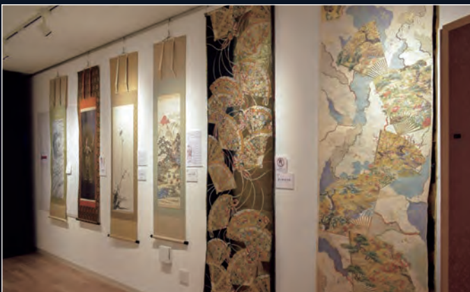
2F 美術館 | 繊細な織で表現された作品の数々をご覧いただけます。